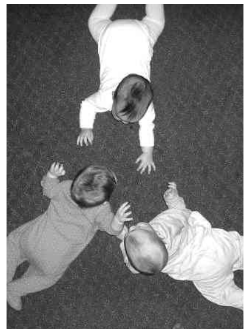
La rencontre des grands esprits.

Les membres d'Objectif sages-femmes sont très actives et motivées et elles sont conscientes que les retombées de leurs démarches ne se concrétiseront qu'à moyen ou long terme, mais elles tiennent bon ! Vous pouvez les aider en signant la pétition en ligne sur le site du Groupe MAMAN à www.groupepaman.org . ❖