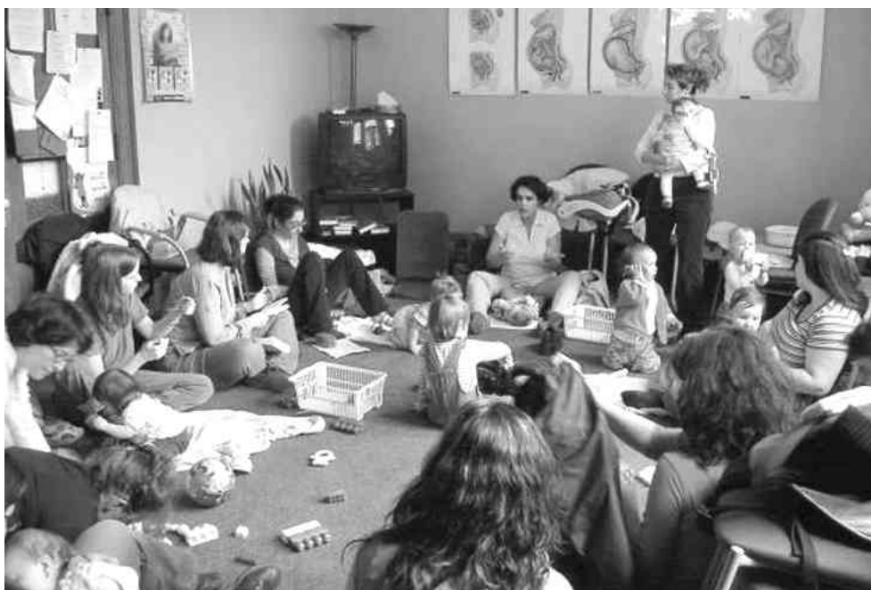
Ambiance d'une rencontre typique du jeudi après-midi à la maison de naissance.